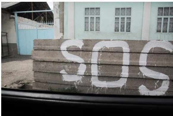
г. Ош, 12 июня 2010 года

По официальным данным, до апрельских событий 2010 года этнические узбеки составляли примерно 14,7% населения южного Кыргызстана, а по мнению независимых источников – 30%. По независимым оценкам, до апреля 2010 года в Кыргызстане проживало более 1 миллиона узбеков. Основная их часть – горожане.