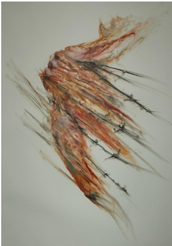
«Прорыв жертвы», 2011 год. Автор: Сергей Игнатьев

Но все это никак не влияло на положение женщин в ходе конфликтов. Более того, в конце 80-х годов ситуация ухудшилась. По мере роста числа конфликтов увеличивалось количество изнасилованных в ходе них женщин. Причем везде - в Европе, в Африке, в Азии - картина была одинаковой.