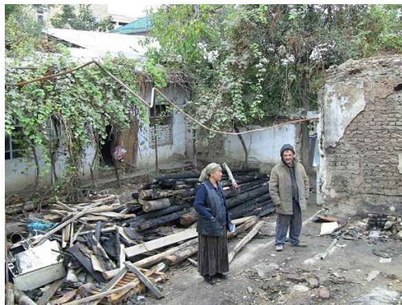
Разрушенный дом Нафисы.

Сестра Юсуфа хочет удочерить ребенка. Во время конфликта, вскоре после трагедии, произошедшей с Юсуфом, она потеряла мужа. Он был убит по дороге на местный рынок. Позже нашли его изувеченное тело: его уши и яички были отрезаны.