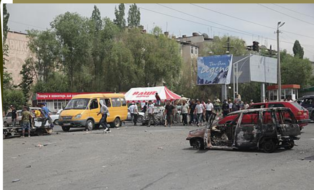
г. Ош, 12 июня 2010 года